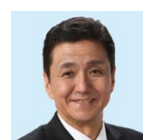
代表理事兼 6代会長代行 岸信夫衆議院議員