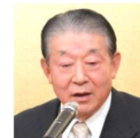
5代会長代行 江口一雄元衆議院議員