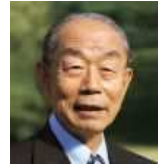
2代会長 福田赳夫元総理大臣