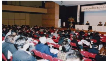
政府へ要請し実現を見た 「海底資源探査専用船」 運航を喜ぶ報告会風景 平成22年11月29日 星陵会館ホールにて開催