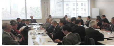
講師の話に 聞き入る参加者

当協会では、毎月1回、議員会館などの会議室にて正午より共に昼食をとり、そのあと、月例講話会を開催しております。この月例講話会では、時宜に応じて、国会議員や各分野の専門家・評論家をお招きし、国内外の諸問題について講話を聞き、意見交換を行なって知識と親睦を深めております。開催数も約40年間で通算700回を超えております。