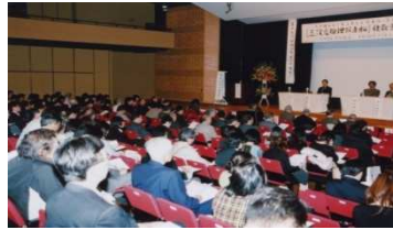
政府へ要請し実現を見た 「海底資源探査専用船」 運航を喜ぶ報告会風景 平成22年11月29日 星陵会館ホールにて開催