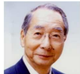
4代会長 塩川正十郎元財務相